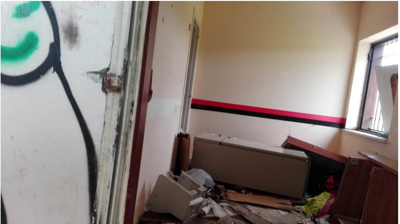
Danneggiamenti ed asportazione dei servizi igienici all'interno dei locali