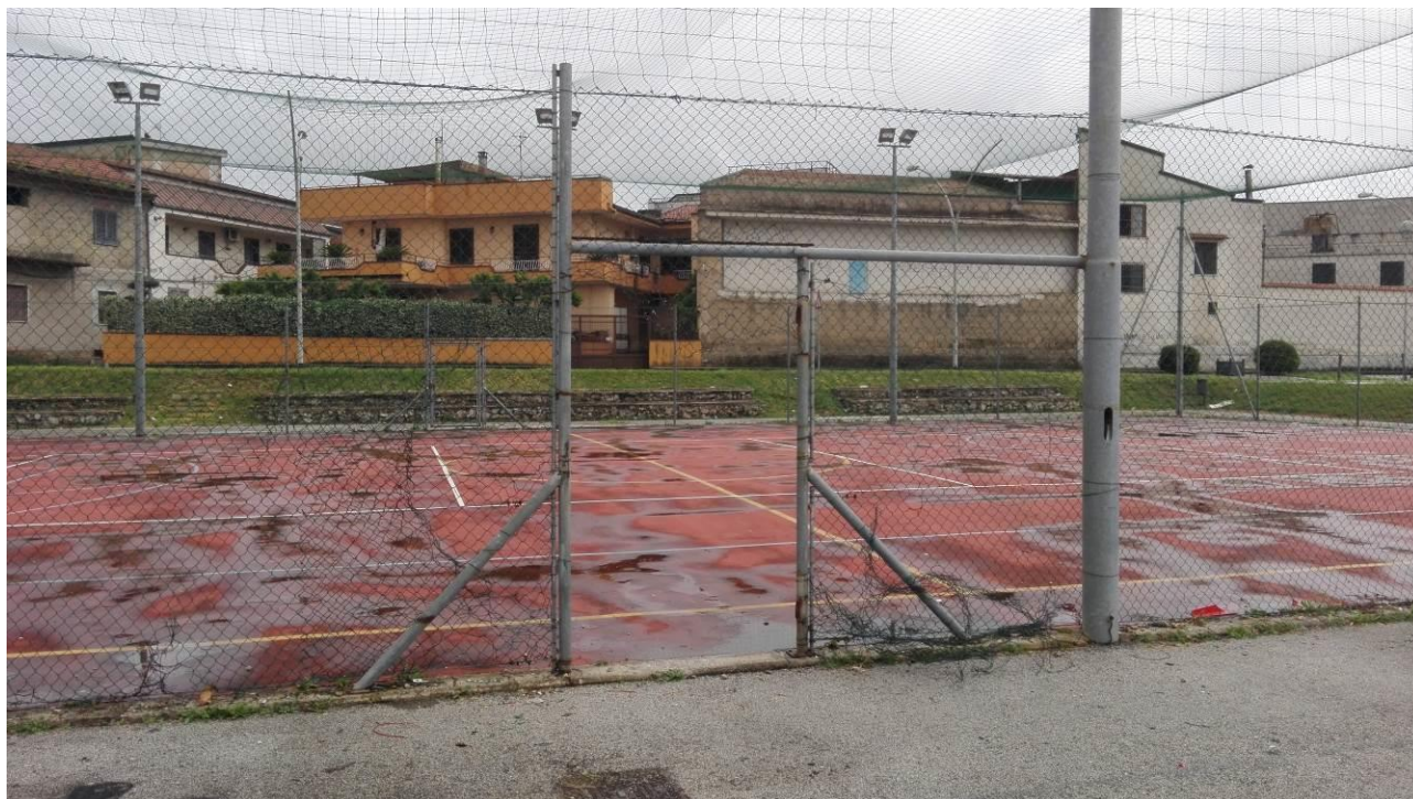
Danneggiamento della recinzione metallica del campo gioco

Si rimettono a tal uopo il rilievo fotografico eseguito: