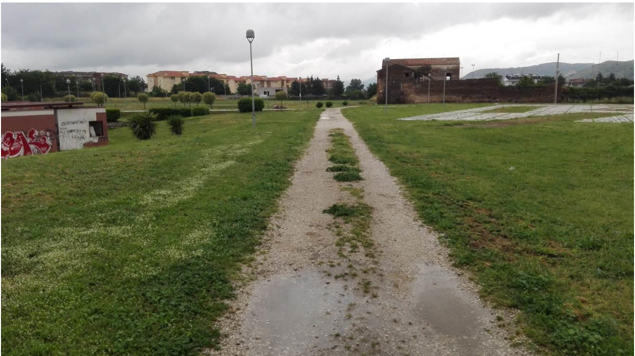
Avvallamenti lungo i tratti di pavimentazione in granagliato calcareo