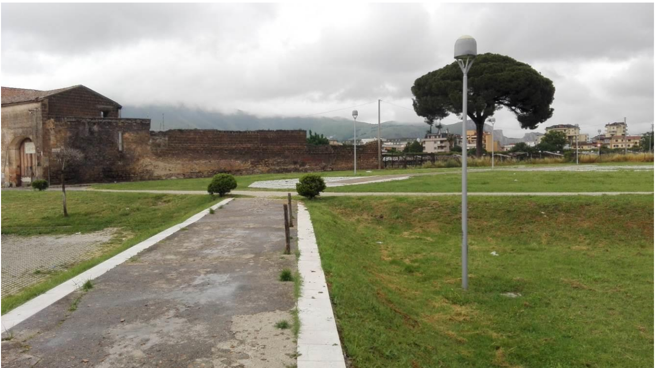
Asportazione globale della staccionata in legno dei diversi percorsi pedonali