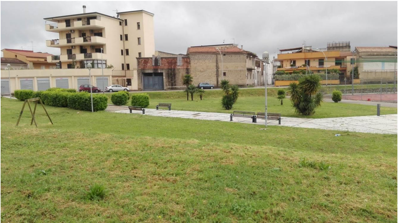
Stato manutentivo degli ultimi arredi esistenti del Parco Urbano