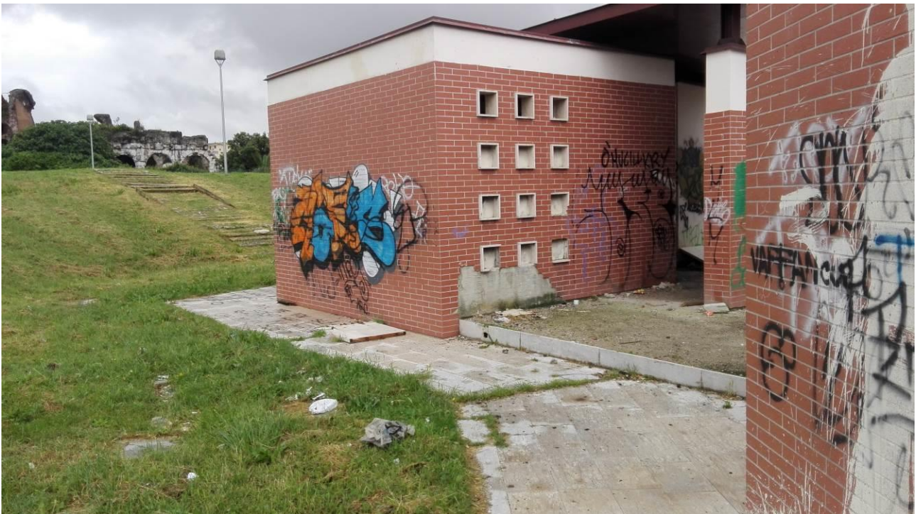
Particolare degli atti vandalici e graffiti sulle pareti ed infissi dei locali