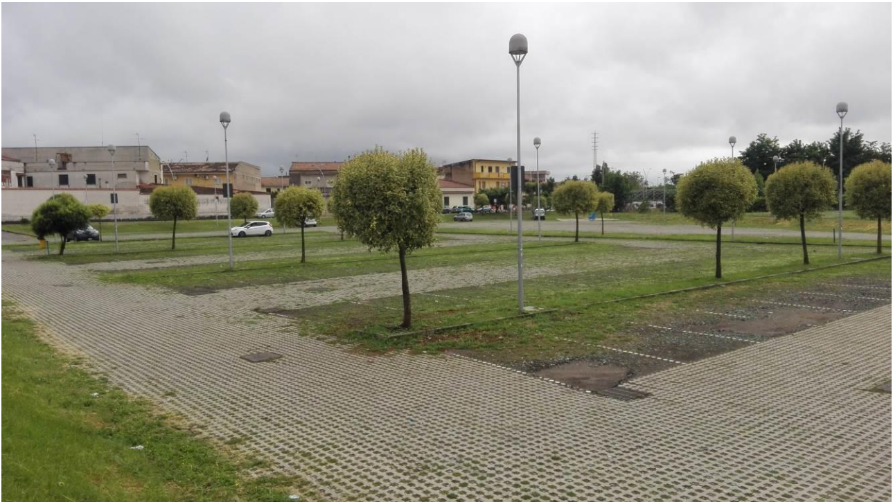
Stato manutentivo del grigliato dell'area parcheggio