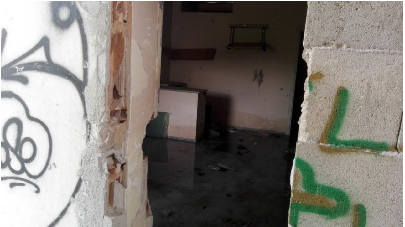
Danneggiamenti alle murature di tamponamento con asportazione delle porte di accesso