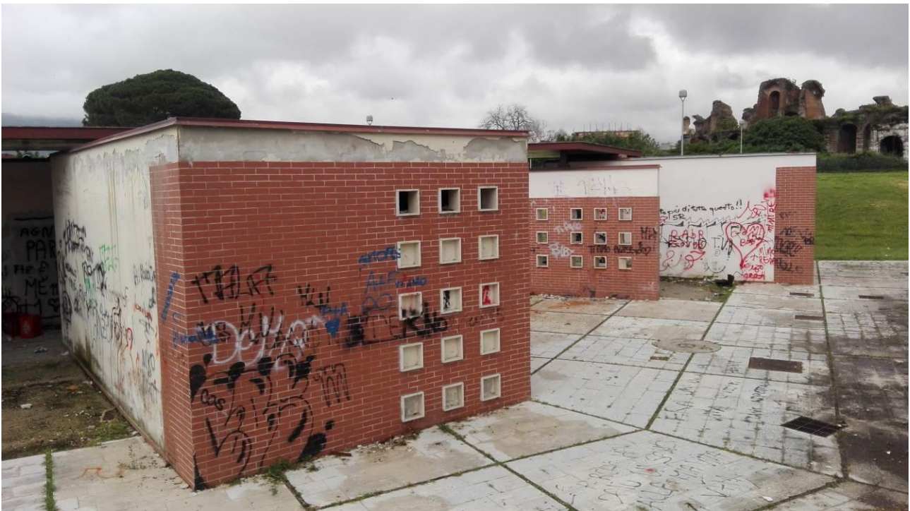
Ulteriori danneggiamenti ed atti vandalici alle pareti esterne dei locali a servizio dell'area