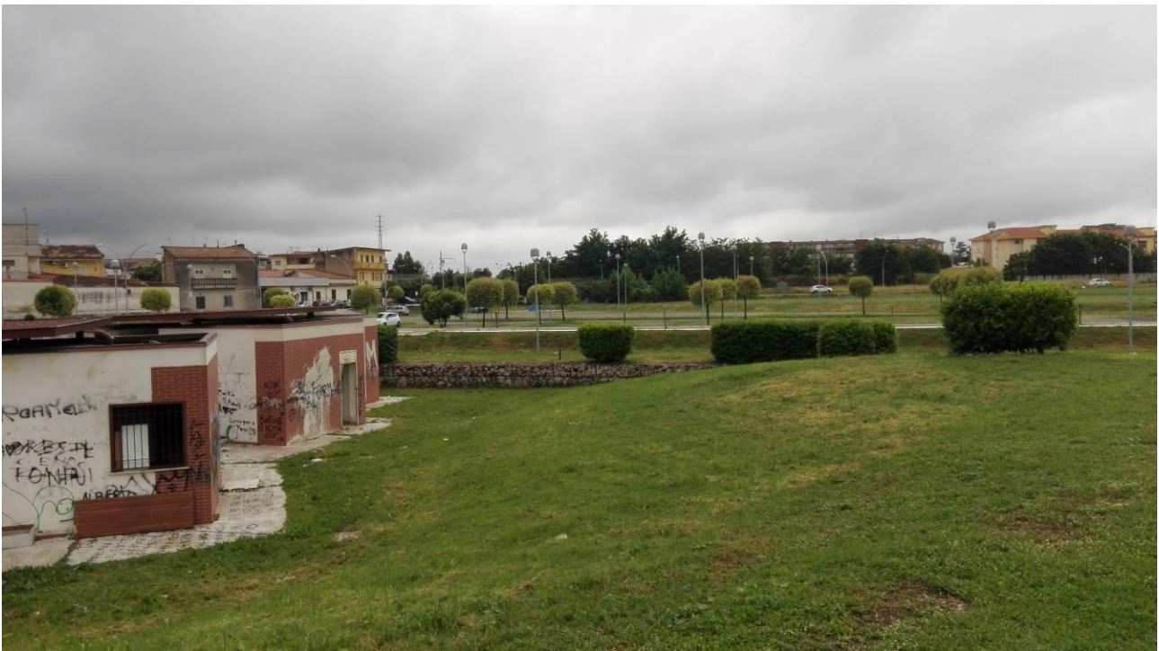
Vista globale d'insieme dei danneggiamenti al Parco Urbano