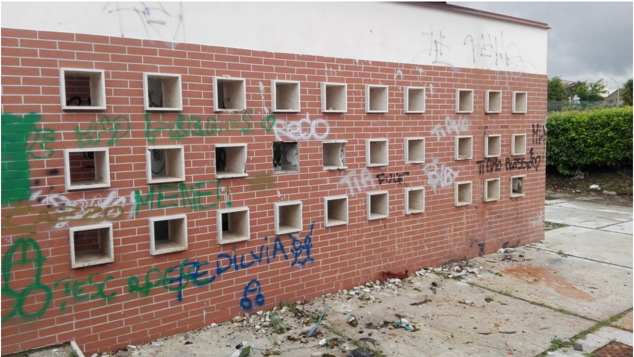
Danneggiamento ed atti vandalici alle pareti esterne dei locali a servizio dell'area