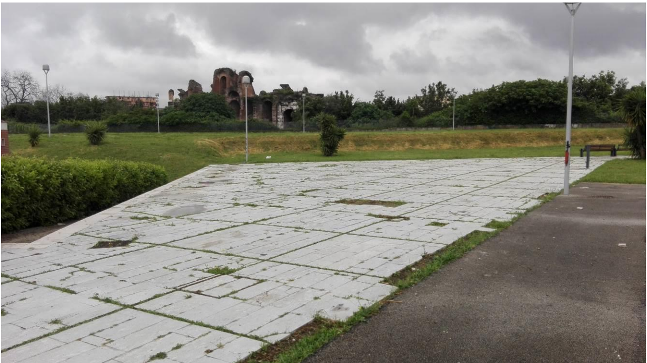
Stato manutentivo della pavimentazione in lastre di pietra