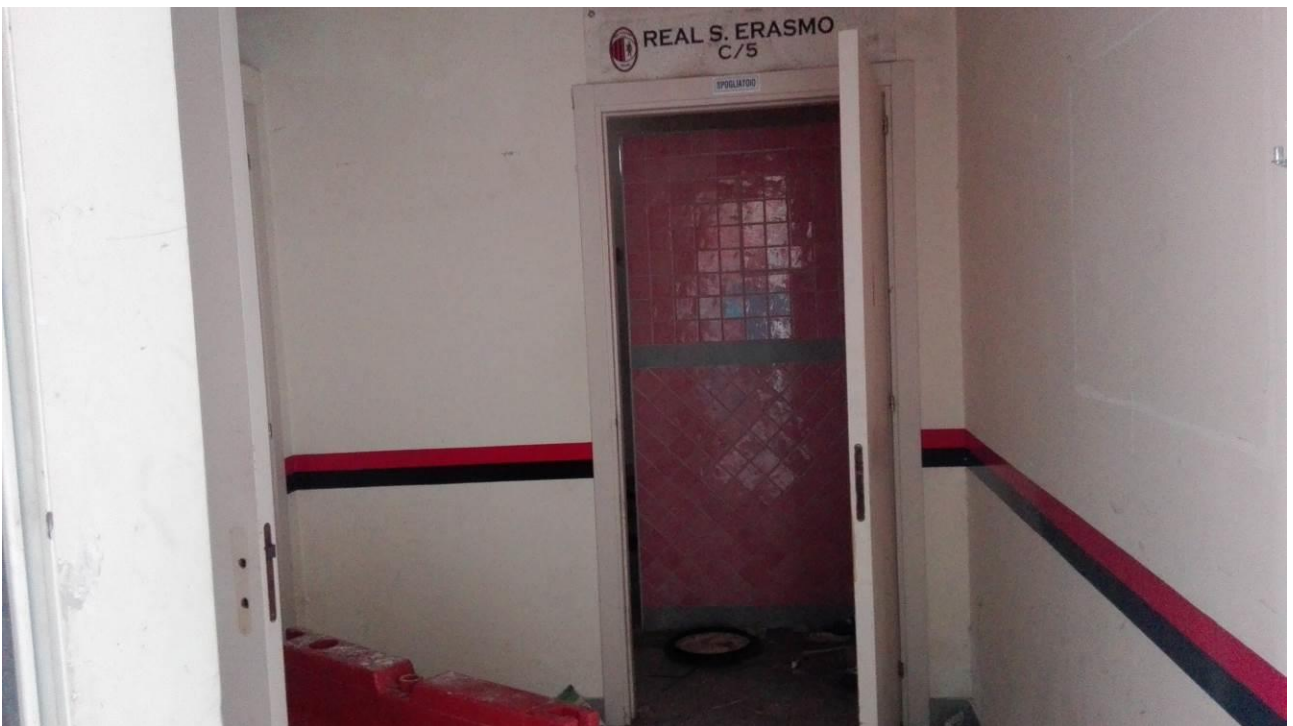
Danneggiamenti ed asportazione dei servizi igienici locali spogliatoi