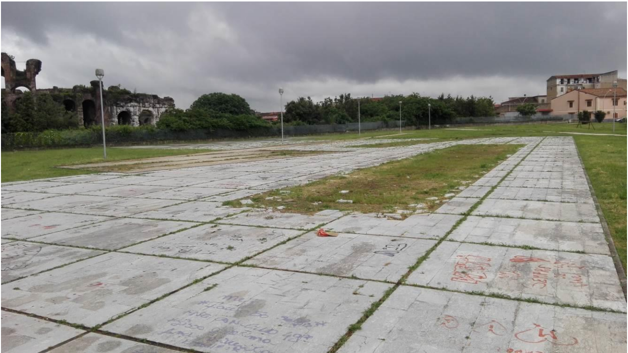
Stato manutentivo dell'altra pavimentazione in lastre di pietra