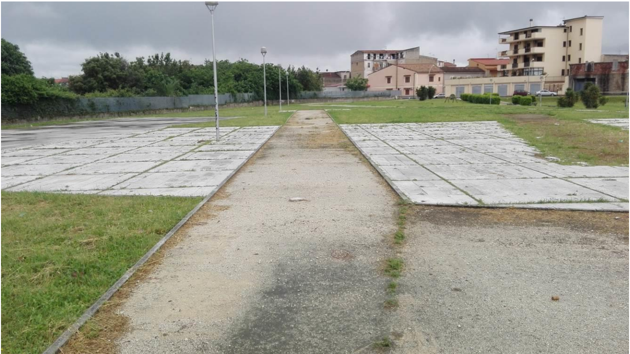
Totale asportazione della pavimentazione in listelli di legno sui percorsi natura