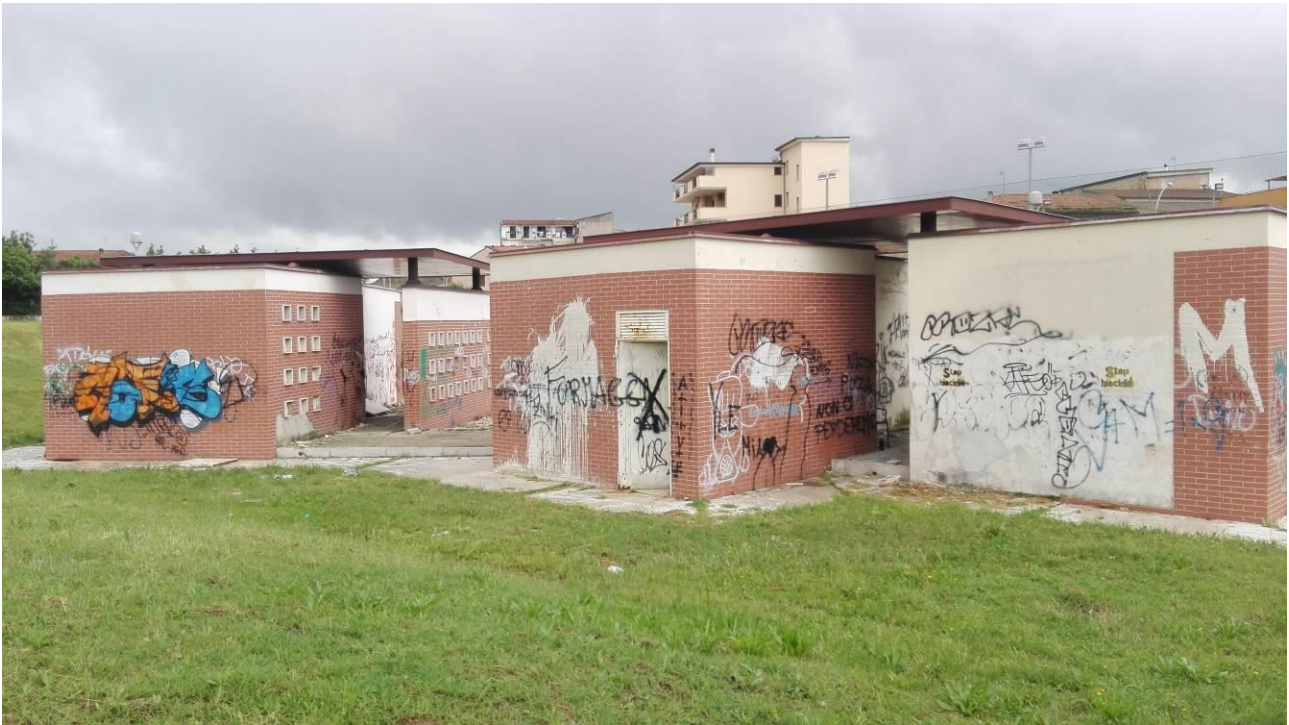
Atti vandalici e graffiti sulle pareti ed infissi dei locali